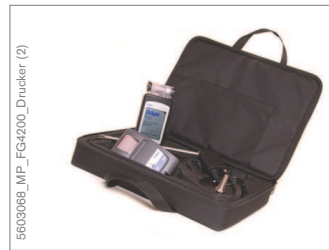
Set Dräger FG4200 con impresora