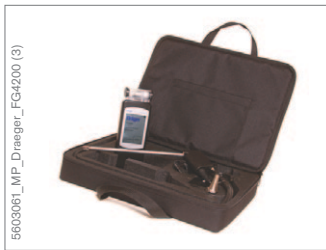
Set Dräger FG4200